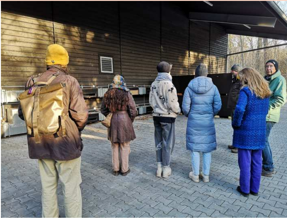
Exkursionsgruppe vor der Halle

EXKURSION SAMENDARRE HESSENFORST IN HANAU