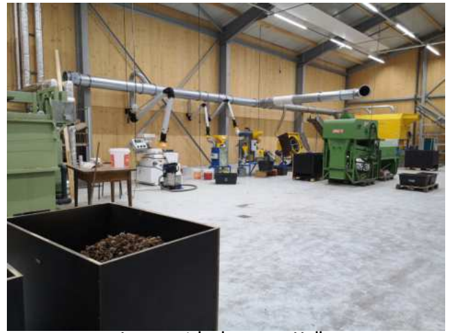
Innenansicht der neuen Halle

Die neue Halle beinhaltet einige sehr moderne, ebenfalls neu angeschaffte, Maschinen zur Aufbereitung und Trennung von Forstsaatgut. Einige Maschinen sind sogar Spezialanfertigungen, wie beispielsweise eine selbstentwickelte Waschanlage Innenansicht der neuen Halle für Eicheln. Die neue Halle ist außerdem ausgestattet mit einer großen Trockenkammer und einer modernen Pellet-Heizanlage, inklusive Pellet-Lager.