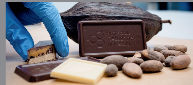
© Titel: Hessen schafft Wissen / Steffen Böttcher